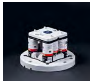
Масштабируемая батарея Многоэлементные, заменяемые и перерабатываемые батареи для надежной эксплуатации и оптимальной цены.