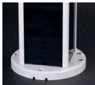
Монтаж Монтаж с помощью 3х, 4х или 5ти болтов М12 на окружности 200 мм. Возможна поставка со стандартными или защищенными болтами.