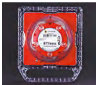
Индикатор цвета Цвет СД наглядно отображается цветом верхней части фонаря.