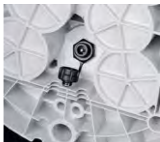
Разъем для зарядки Дополнительный разъем для зарядки позволяет комфортно заряжать батареи сетевым ЗУ.