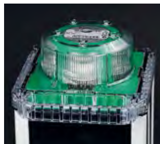
Оптический блок Прочная, устойчивая к УФ линза с углом вертикального рассеяния 8° или 10°.