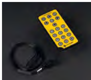
ИК Программатор Проверка состояния батареи, выбор характера проблеска, светосилы и отключение фонаря с помощью мини ИК программатора