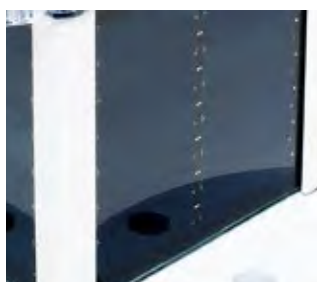
Солнечная панель Высоко эффективные ячейки защищены прочными покрытыми порошковой краской алюминиевыми профилями.