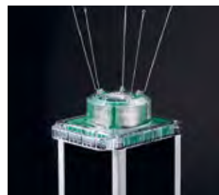
Защита от птиц Защита от птиц из нержавеющей стали. 5 штырей входят в комплект поставки, возможна установка 10 штырей.